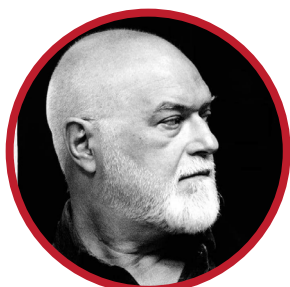
Σπύρος Τσιφτσής, Σκηνοθέτης