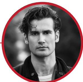
Αναστάσης Ροϊλός, Ηθοποιός, Θεατρολόγος