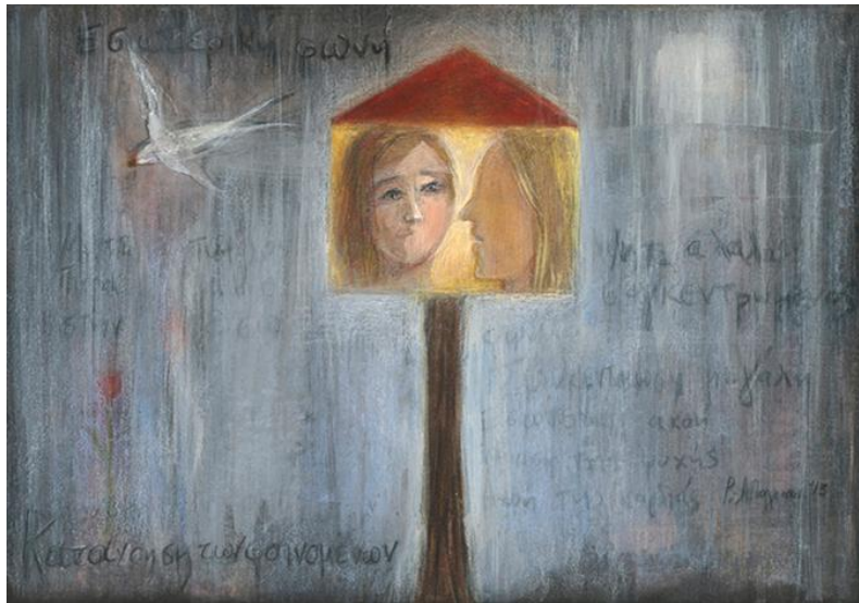
La voix intérieure