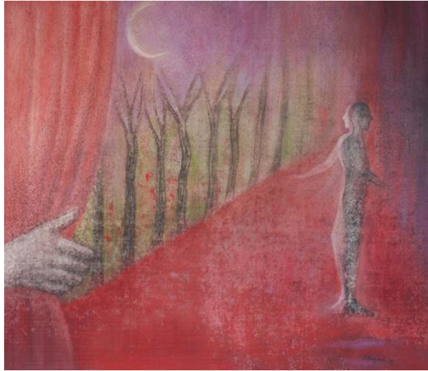
Le rideau pourpre