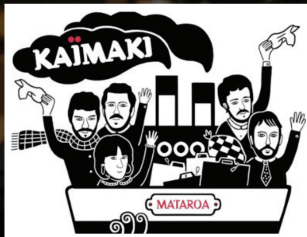
Illustration Pochette : Zeina Abirached

Le groupe, du nom de cette célèbre glace au mastic, est né en 2010 d'une entente humaine et de la volonté de développer ce projet autour de la Grèce, du jazz et de la poésie.