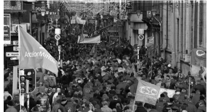
Αποψη από την διαδήλωση στις Βρυξέλλες

Τα τρία μεγάλα συνδικάτα της χώρας ( CSC , FGTB, ABVV) με την πρωτοβουλία τους αυτή θέλησαν να ασκήσουν πίεση προς την κυβέρνηση ώστε να αποτραπούν τα μέτρα λιτότητας σε βάρος των πολιτών διότι εκτιμούν πως έχουν ήδη πληρώσει αρκετά την κρίση,