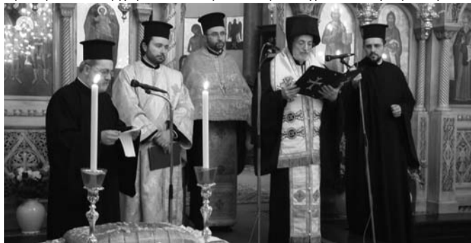
Στη συνέχεια οι παρευρισκόμενοι,

λάδας και τον Πρόξενο της Κύπρου, αλλά και εκπρόσωποι άλλων Ορθόδοξων χωρών. Παρούσα ήταν και η στρατιωτική ηγεσία της Ελληνικής αντιπροσωπείας στο ΝΑΤΟ. Ο Σεβασμιότατος απευθυνόμενος στους πιστούς εξέφρασε τις θερμότητες ευχές του για υγεία, πρόοδο και οικογενειακή ευτυχία. Στη συνέχεια οι παρευρισκόμενοι,