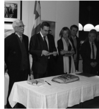
Η βασιλόπιτα της ΝΔ στις Βρυξέλλες

λερούα οργάνωσε χορευτική εκδήλωση με ζωντανή μουσική, την οποία συνδύασε με την κοπή της βασιλό-