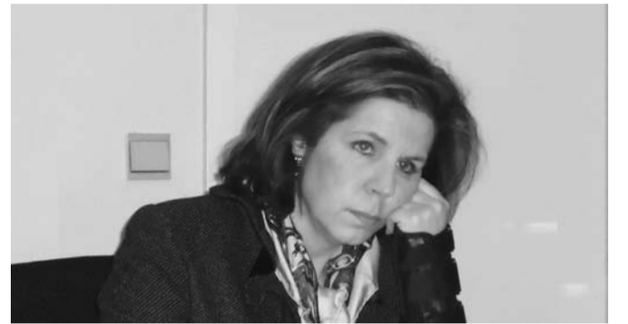
Η Υφυπουργός Παιδείας κ. Εύη Χριστοφιλοπούλου

τάσχω... Παρά το γεγονός ότι μέχρι πριν ένα χρόνο ήμουν πρόεδρος του Συλλόγου Γονέων και Κηδεμόνων των Σχολείων Μητρικής Γλώσσας, είμαι Πρόεδρος του Ελληνικού και Διαπολιτισμικού Κέντρου Βρυξελλών στο οποίο λειτουργούν